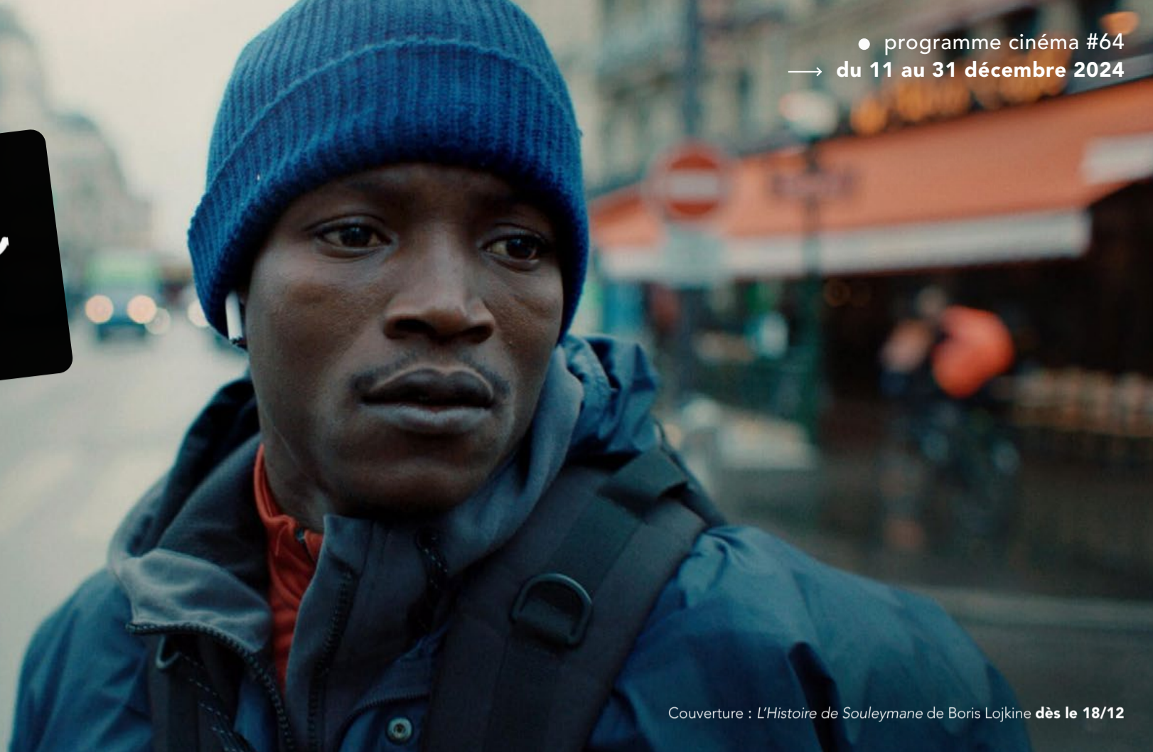
Couverture : L'Histoire de Souleymane de Boris Lojkine dès le 18/12